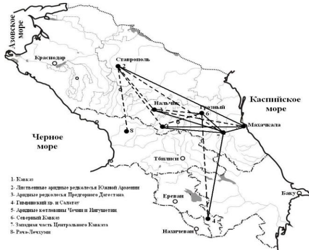
Рис. 1. Нанесенные на карту Кавказа плеяды, соединяющие наиболее сходные по спектрам семейств флоры Кавказа (— P_s = 0,870 ; - - - - P_s = 0,805 )

На рис. 1 показаны нанесенные на карту Кавказа корреляционные плеяды, построенные на основе коэффициента Спирмена. Самое большое сходство спектров семейств флоры ЛАР Южной Армении наблюдается с флорой Гимринского хребта и Салатау (Дагестан) (Солтанмурадова, 2002), что безусловно говорит об общей основе происхождения флор редколесий Южного Закавказья и Дагестана.