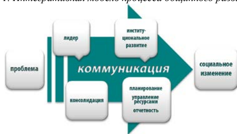
Рис 1. Интегративная модель процесса общинного развития

Так, теория коммуникации дает возможность выработать практические подходы для преодоления зависимости общины от внешних сил и перехода от зависимости к взаимозависимости, а институциональное развитие укрепляет адаптивно-адаптирующую функцию самоорганизации. При этом, участие на уровне общины не противопоставляется централизованному управлению, ведь есть проблемы, и могут возникать чрезвычайные ситуации, которые требуют выполнение прямых указаний из центра. Развивая вертикальный (одновременно «сверху вниз» и «снизу вверх») и горизонтальный подходы и обеспечивая возможность общественного участия, процесс общинного развития делает картину гражданской самоорганизации современного армянского общества целостной.