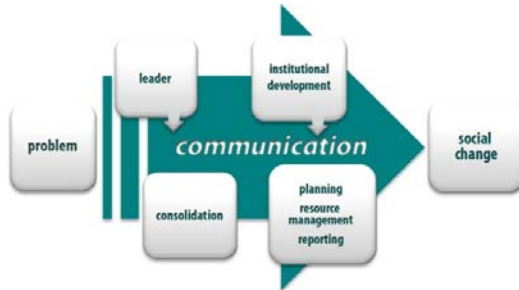
Figure 1. The integrative model of the community development process

Efficiently managed, these factors can stimulate community development, while underestimation or ignorance of each of them entails the risk of slowing down or stopping the process. The theory of communication can provide tools for developing new practical approaches to overcome the dependence of the communities from external forces and move from dependence to interdependence, while the institutional development can strengthen their organisational adaptability. Community-level participation does not oppose to the central planning. There may be problems or emergencies that require guidance or direct intervention from the central level, however, developing vertical (in this case, both "top down" and "bottom up") and horizontal approaches and providing opportunity for public participation, the community development processes make the picture of civic organising in the modern Armenian society complete.