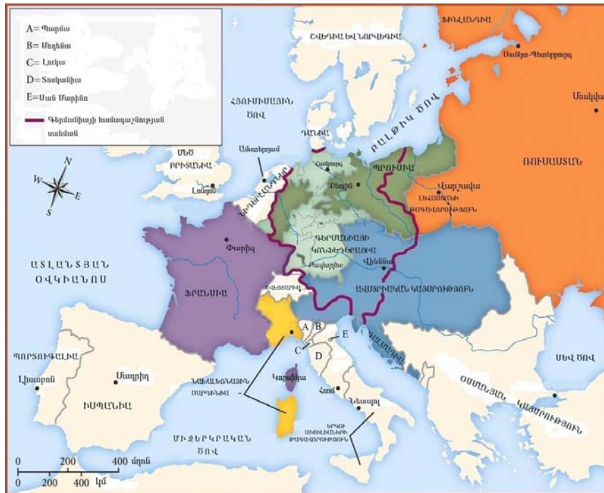
Նկ. 2 Եվրոպայի քաղաքական քարտեզը 1815-1848 թթ.

3.8 քննարկվում է Եվրոմիության ընդլայնման հարցը: