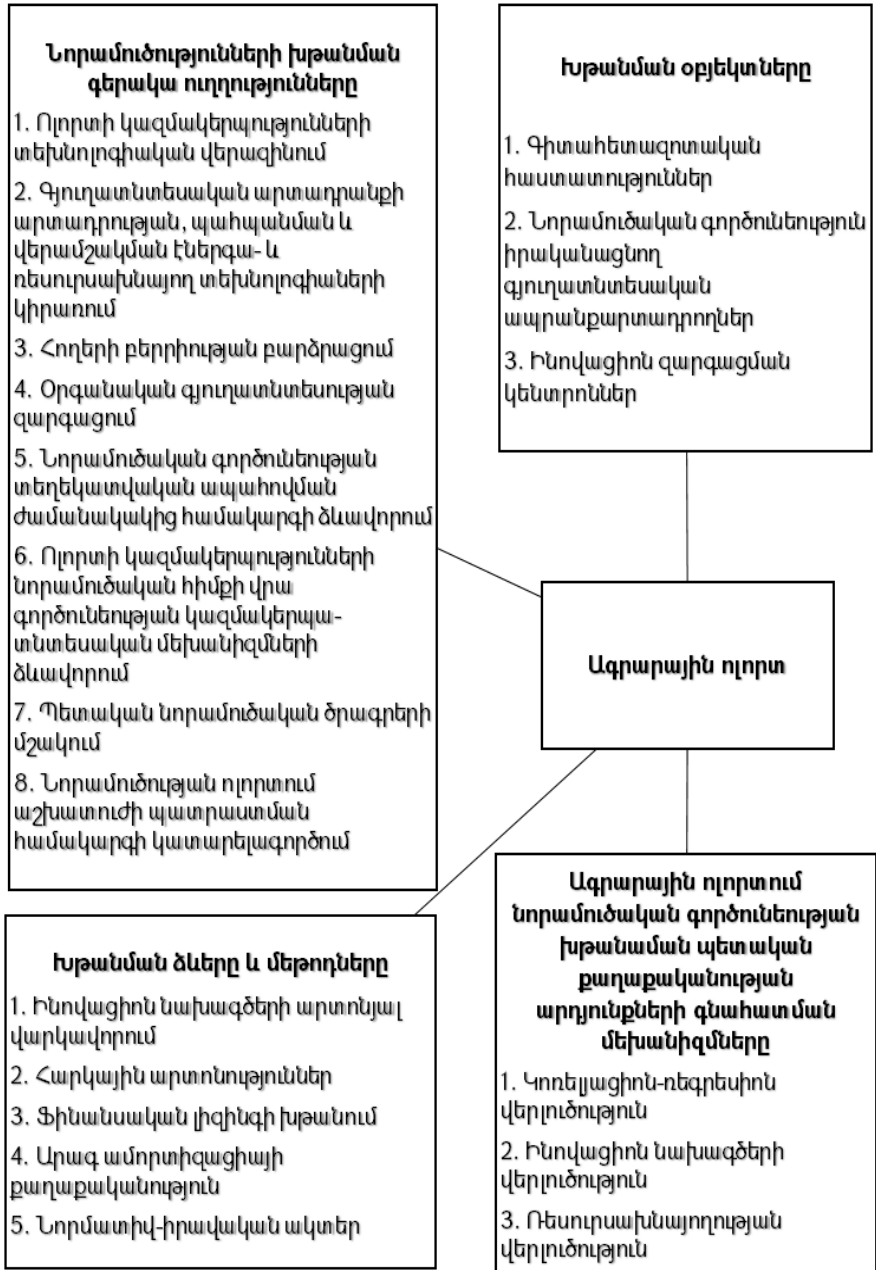
Գծապատկեր 2. Ագրարային ոլորտում նորամուծական գործունեության խթանման անուղղակի համակարգը