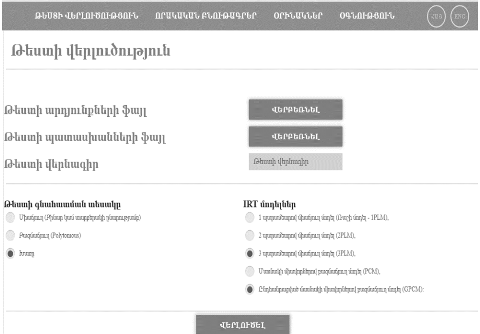
Նկար 2. Համակարգի օգտվողի ինտերֆեյսի գլխավոր էջի տեսքը:

օգտվողին դիմել համակարգին լոկալ ցանցի միջոցով կամ համացանցի միջոցով գործարկելով այն web դիտարկիչի միջավայրում: Օգտվողի ինտերֆեյսը հասանելի է երկու լեզուներով՝ հայերեն և անգլերեն, ներառված են հետևյալ բաժինները՝ «Թեստի վերլուծություն», «Որակական բնութագրեր», «Օրինակներ», «Օգնություն», «Լեզվի ընտրություն»: Օգտվողի ինտերֆեյսի գլխավոր էջը պատկերված է նկար 2-ում: