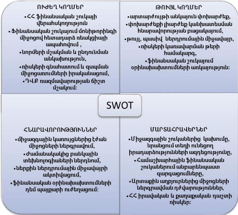
Գծապատկեր 3. ԿԲ-ի գործունեության SWOT վերլուծություն՝ ՀՀ ԿԲ օրինակով 12

անհրաժեշտ է վերլուծել հենց նշված կառուցի գործունեության արդյունավետությունը: Այդ նպատակով, նախ՝ պետք է լուսաբանել ԿԲ-ի գործունեության ուժեղ և թույլ կողմերը, որոնցով էլ պայմանավորված են վերջինիս իրագործման հեռանկարները, ապա բացահայտել հնարավոր մարտահրավերները (գծապատկեր 3):